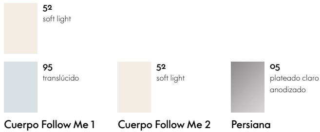
Cuerpo Follow Me 1